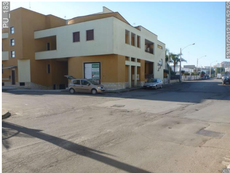
Fig. 2 - Immagine dell'area della grotta PU_183 riportata in Catasto Grotte

DIPARTIMENTO AMBIENTE, PAESAGGIO E QUALITÀ URBANA SEZIONE TUTELA E VALORIZZAZIONE DEL PAESAGGIO SERVIZIO OSSERVATORIO E PIANIFICAZIONE PAESAGGISTICA