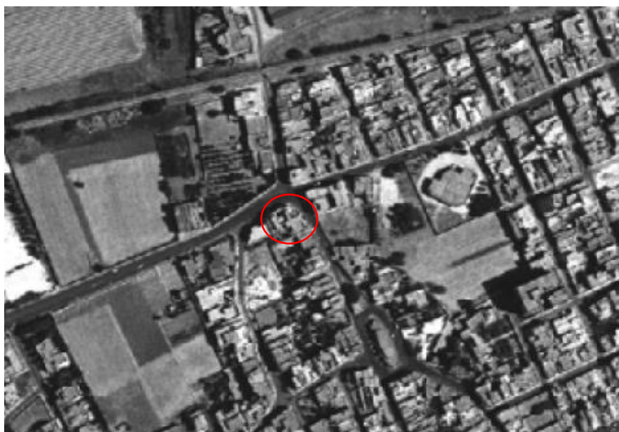
Fig.3 – Ortofoto 1994 -Fonte: Geoportale Nazionale. Evidenziato in rosso l'edificio sorto nell'area in esame.

Si rappresenta inoltre che, così come affermato dal proponente, l'edificio insistente sull'area in esame risale ai primi anni '90. ( Fig.3)